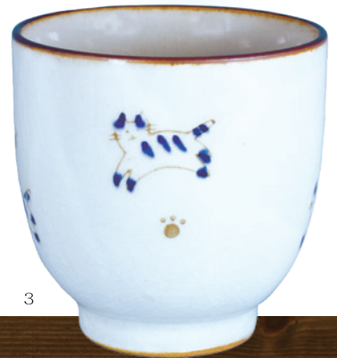
1 《かこさとし氏の湯のみ》(加古総合研究所蔵)、2 《いわさきちひろ氏の湯のみ》(ちひろ美術館蔵)、3 《池上遼一氏の湯のみ》(個人蔵)