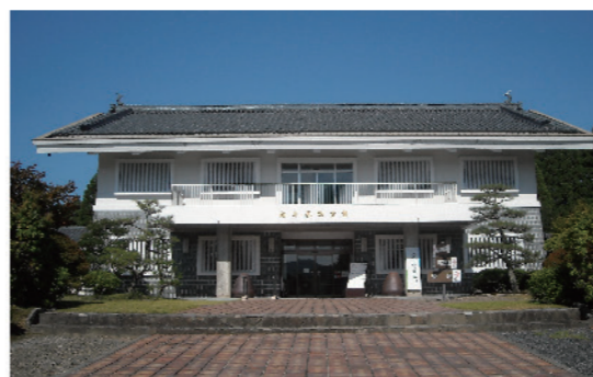
福井県陶芸館 資料館正面