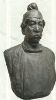
〈天心像〉 福井県出身の彫刻家 雨田光平氏が 制作した岡倉天心の胸像

福井県ゆかりの偉人「岡倉天心」を顕彰し、 茶の湯を通して日本六古窯の一つである越前焼をはじめとした 福井県の伝統工芸・文化に触れる茶会。